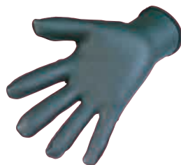
手のひら側: 1mmメッシュスキン

手の平には滑り止め効果のある 1mmメッシュスキンゴムを使用し、手の甲には 0.5mmエアースキンゴムを使用することにより高い紫外線防止と風や水の侵入を軽減させます。