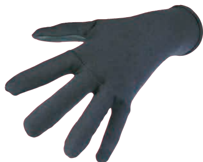
甲側:0.5mm AIR SKIN