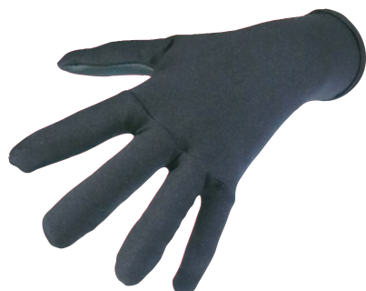
甲側:0.5mm AIR SKIN