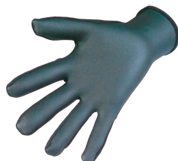
手のひら側: 1mmメッシュスキン

手の平には滑り止め効果のある 1mmメッシュスキンゴムを使用し、手の甲には 0.5mmエアースキンゴムを使用することにより高い紫外線防止と風や水の侵入を軽減させます。