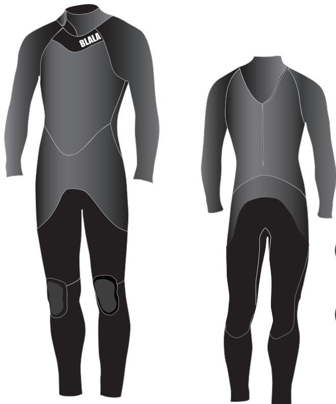
※ 表面の素材仕様イラストです