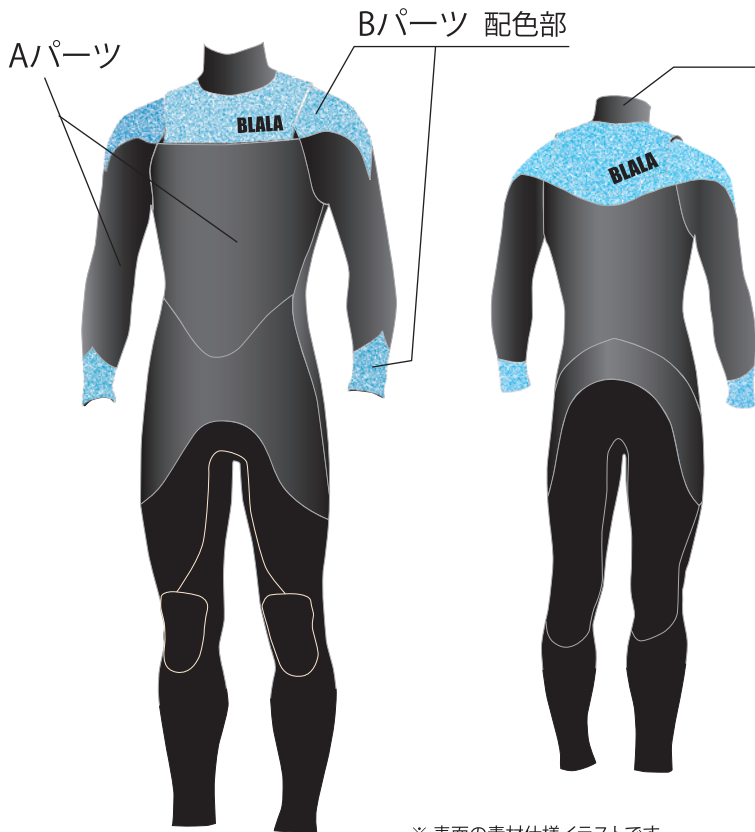
※ 表面の素材仕様イラストです

フラッグシップモデルであるNON ZIP セミドライスーツ。耐久性と脱着性を向上しました。 BLALAオリジナルのHFS(ハイドロフラップシステム)で水の侵入を最小限に抑えます