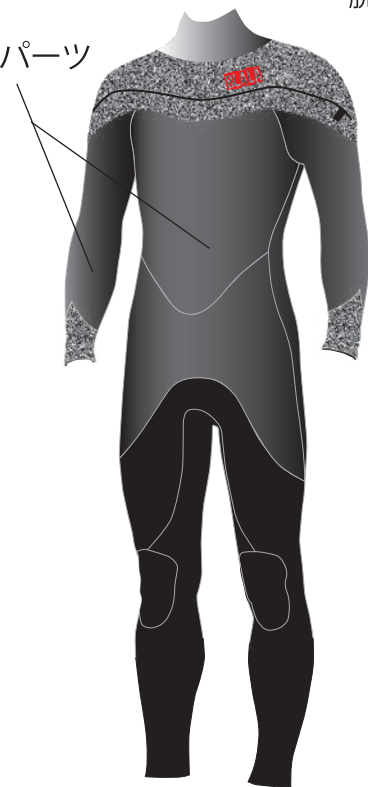
※ 表面の素材仕様イラストです

ロングネックまたはショートネックが選べます (ご指定がない場合はロングネックになります)